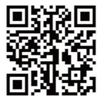
申し込みフォームのQRコード

当日のYouTube(11月23日午後1時公開)はこちらのQRコード→アドレスからアクセスしてください!